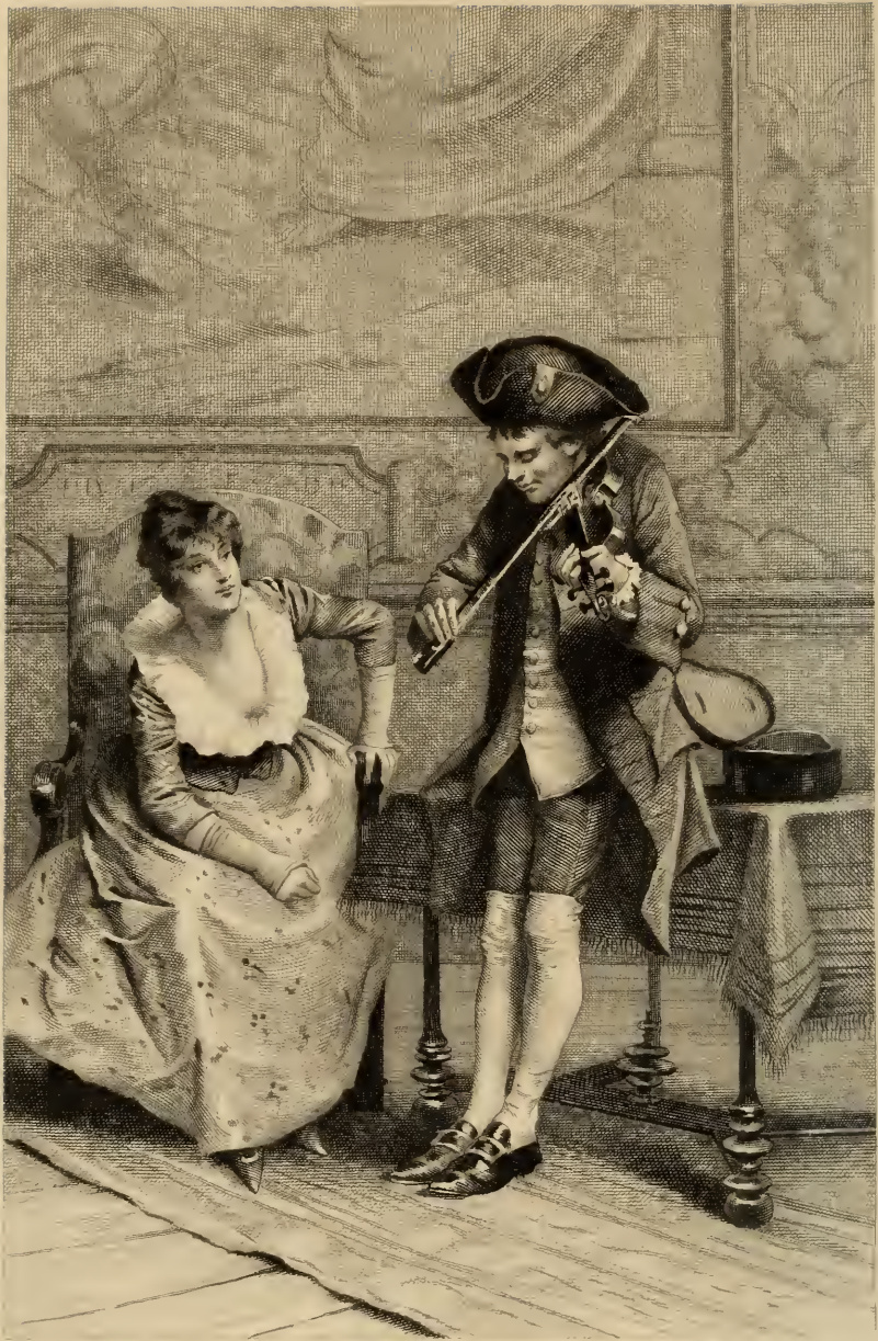
Dessin de François Flanergé